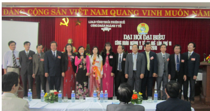
Ban chấp hành Công đoàn ngành Y tế nhiệm kỳ 2013-2018.

Đoàn kết, dân chủ, đổi mới hoạt động công đoàn vì quyền và lợi ích hợp pháp chính đáng của CBCNV - LĐ và sự nghiệp chăm sóc bảo vệ