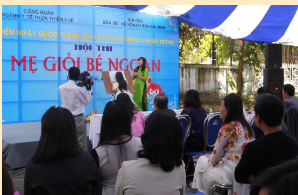
Hội thi “Mẹ giỏi bé ngoan”