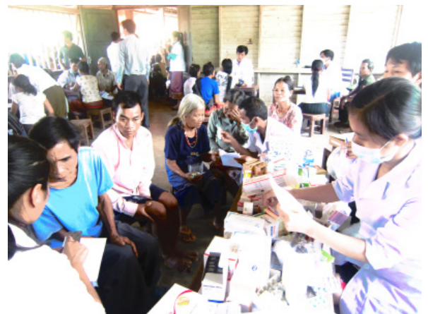
Đoàn TNCSHCM Sở Y tế tham gia khám bệnh tại Tạ Ôi, tỉnh Salavan, CHDCND Lào.

Với những gì đã đạt được trong năm 2012, năm 2013 Đoàn cơ sở Sở Y tế đã xác định mục tiêu vững chắc: tăng cường bồi dưỡng lý tưởng, đạo đức cách mạng, nâng cao bản lĩnh chính trị, trình độ chuyên môn nghiệp vụ, thể chất và năng lực hội nhập cho thanh niên; xây dựng Đoàn TNCS Hồ Chí Minh Sở Y tế vững mạnh toàn diện, xứng đáng là đội dự bị tin cậy của Đảng, là lực lượng chính trị nòng cốt của cơ quan đơn vị. ■