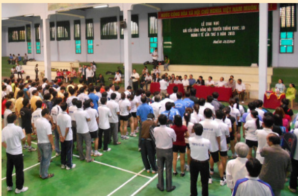
Khai mạc giải cầu lông đồng đội truyền thống CNVCLĐ ngành y tế lần thứ X năm 2013