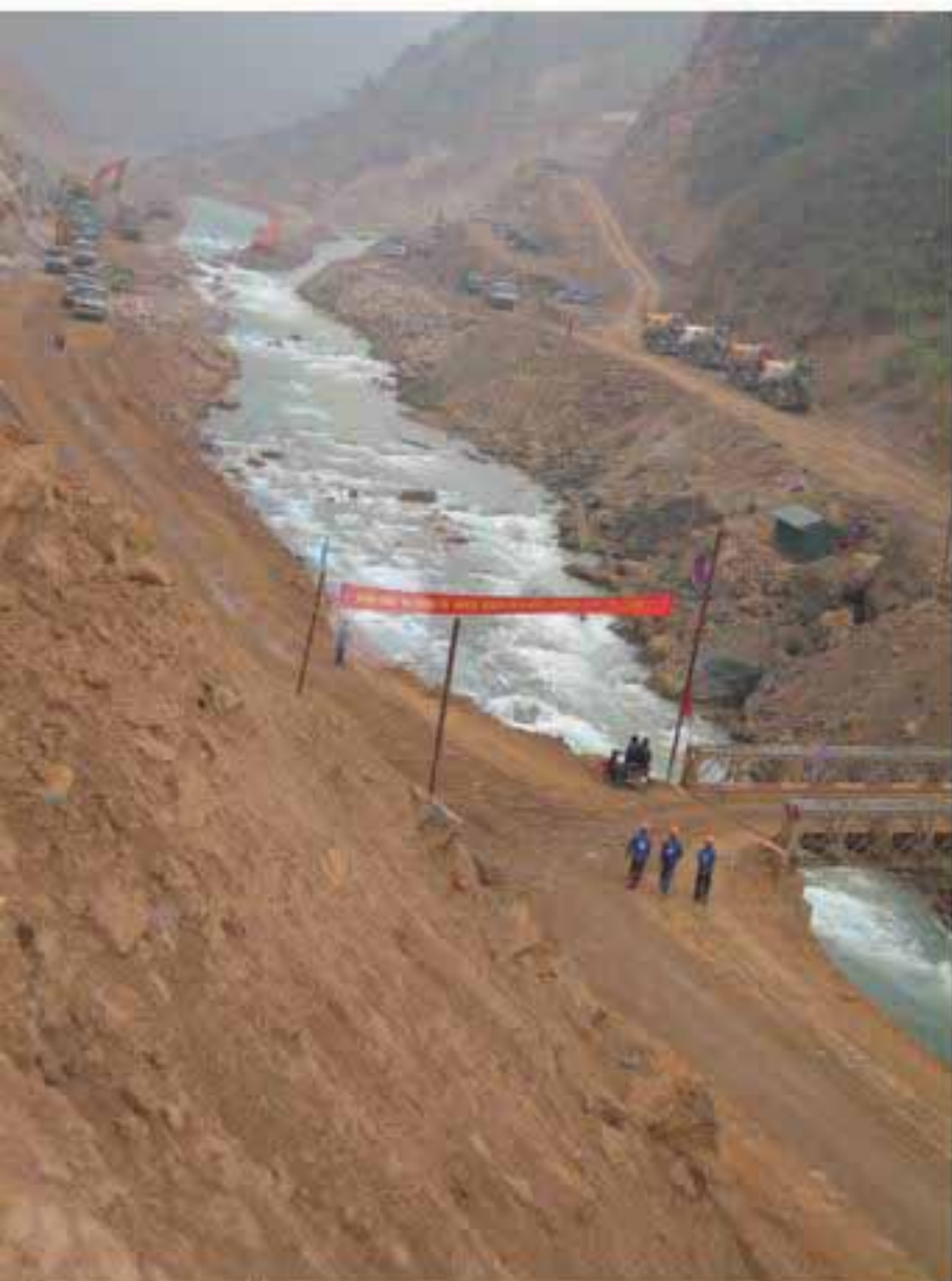
Dòng Nho Quế hung hàn bị khuất phục