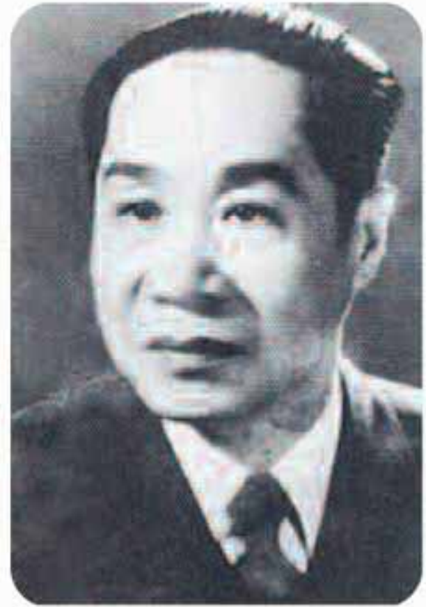
Chân dung Bộ trưởng Hoàng Tích Trý

Giáo sư - Bác sỹ Hoàng Tích Trý xuất thân trong một gia đình nho học khoa bảng giàu truyền thống yêu nước, trong gia đình có nhiều người đỗ Nhị Nguyên, Tam Nguyên Tiến sỹ. Vì ghét thực dân Pháp nên Cụ thân sinh ra ông không ra làm quan, mà tham gia phong trào Đông Kinh Nghĩa Thục. Ông đã chọn con đường du học và đã tốt nghiệp bác sỹ y khoa tại Paris (Pháp) năm 1932 và về nước ngay sau đó để tham gia cách mạng.