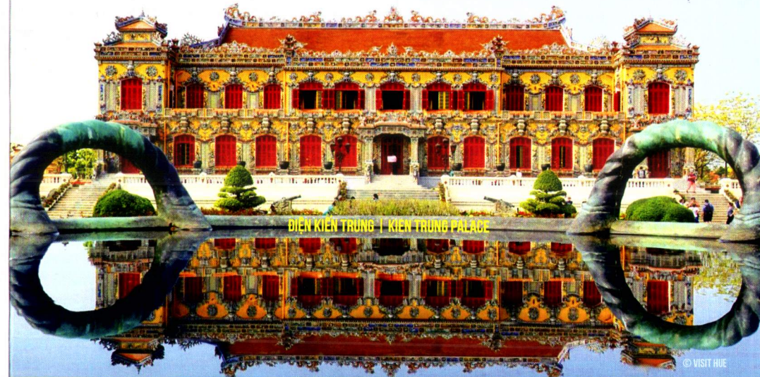
ĐIÊN KIẾN TRÚNG | KIẾN TRÚNG PALACE

Chào mừng 130 năm thành lập Bệnh viện Trung ương Huế CELEBRATING THE 130 TH ANNIVERSARY OF ESTABLISHMENT OF HUE CENTRAL HOSPITAL