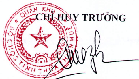
Đại tá Ngô Nam Cường