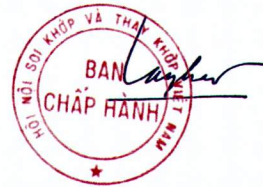
TS BS Tăng Hà Nam Anh