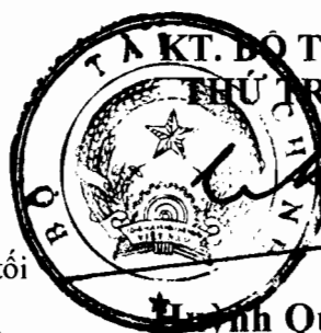
Nguyễn Quang Hải