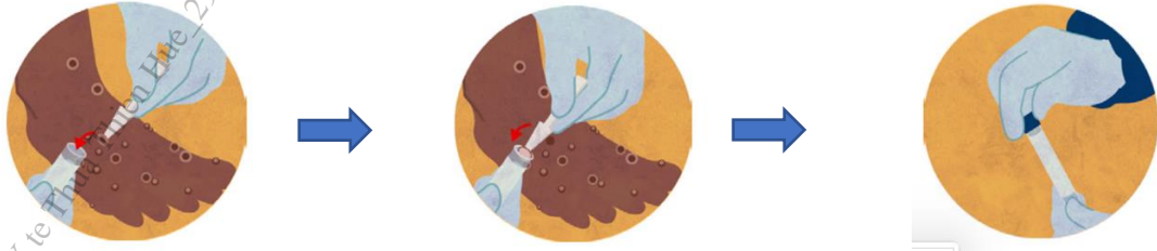
Hình ảnh minh họa về lấy mẫu da/vảy khô từ vết tổn thương

thương): sử dụng panh kẹp hoặc dụng cụ gấp (có đầu không sắc) vô trùng để gấp toàn bộ hay một phần da/vảy khô (kích thước ít nhất 4mmx4mm) rồi cho vào ống vô trùng (ống 1,5ml hoặc ống 5ml) không chứa môi trường vận chuyển. Sử dụng băng cá nhân để băng lại vết thương sau khi lấy mẫu.