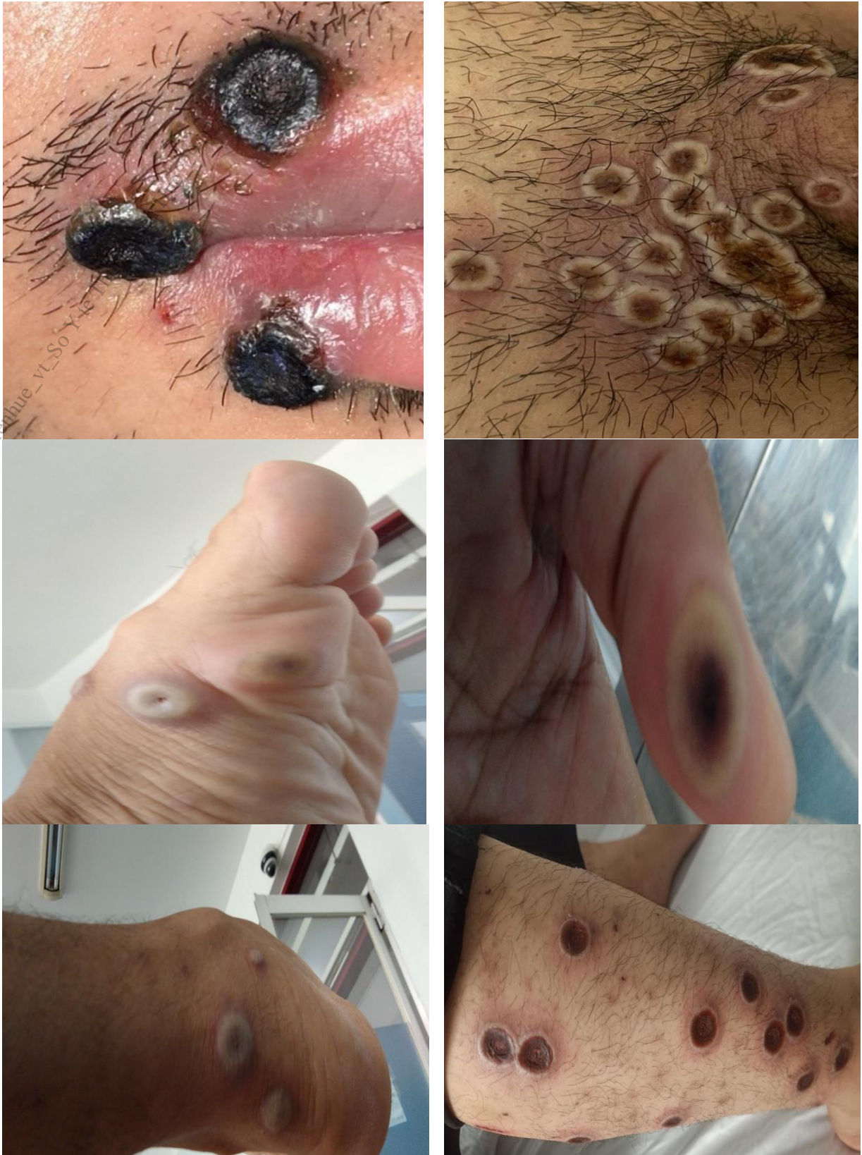
Hình 2. Hình ảnh tổn thương sâu